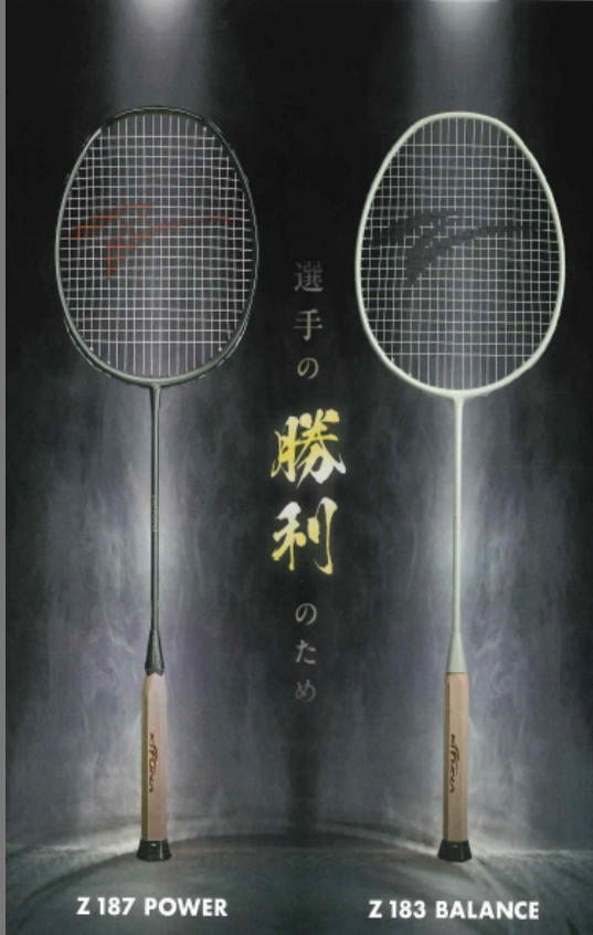
Z 187 POWER

Z187POWER はパワー系選手向けに高速スマッシュで勝利に貢献するよう設計されています。シャフトは細く且つフレーム面は小さく設計されているため、高速振り抜きから発揮されるパワーを伝えやすい構造となっています。さらに高密度EPにより振動軽減作用を施し、ハイパワーによる身体への負担を軽減させます。